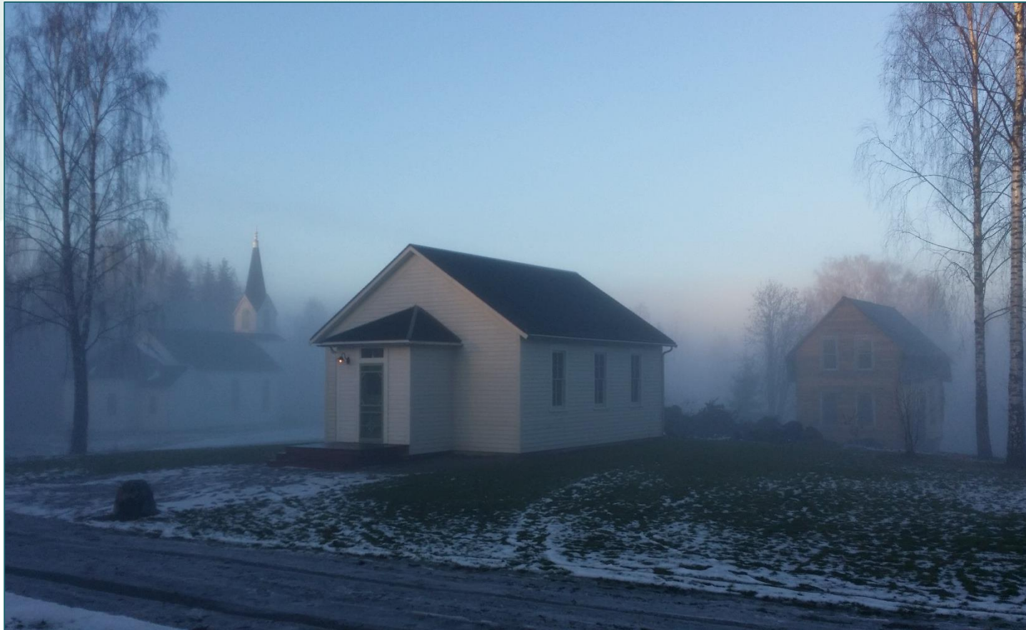
Utvandrer muse et