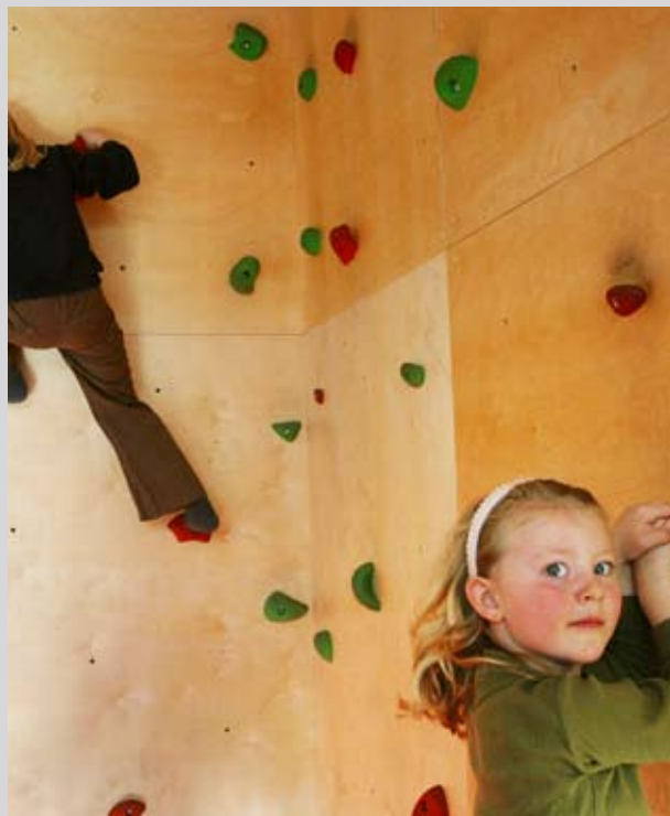
Asker bibliotek.

Hovedsatsingen i dette målområdet er å styrke og fornye kompetansen i biblioteksektoren. Bibliotekforskningen skal gi ny kompetanse til praksisfeltet, og det skal være et samspill mellom disse. Målet er at befolkningen skal ha tilgang til bibliotek med bred og oppdatert kompetanse.