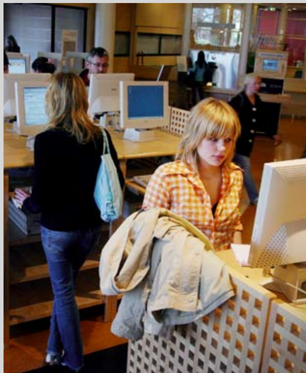
HUMSAM-biblioteket, Universitetet i Oslo.

Den andre hovedsatsingen skal fremme bibliotekene som ressurser for læring og for kultur- og litteraturformidling. Bibliotekene skal også styrkes som bidragsytere til integrering og kulturelt mangfold.