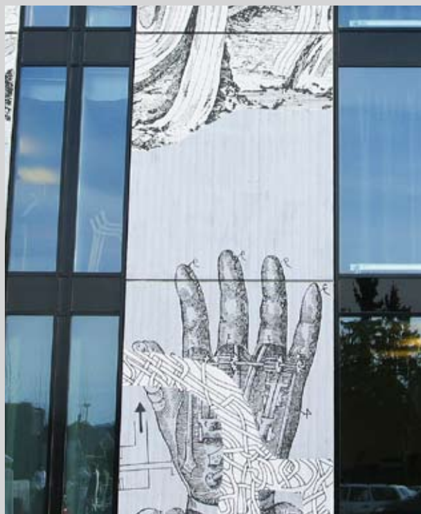
Høgskolebiblioteket i Akerhus.

Større bibliotek opprettes ved at flere kommuner innenfor et geografisk område samler sine bibliotekressurser til et nytt konsolidert bibliotek. Den nye organisasjonen skal ha en biblioteksjef med ansvar for bibliotekets samlede virksomhet. Det inkluderer ansvar for et samlet personale, økonomi, tjenestetilbud og driften av hovedbibliotek, filialer, bokbuss mm.