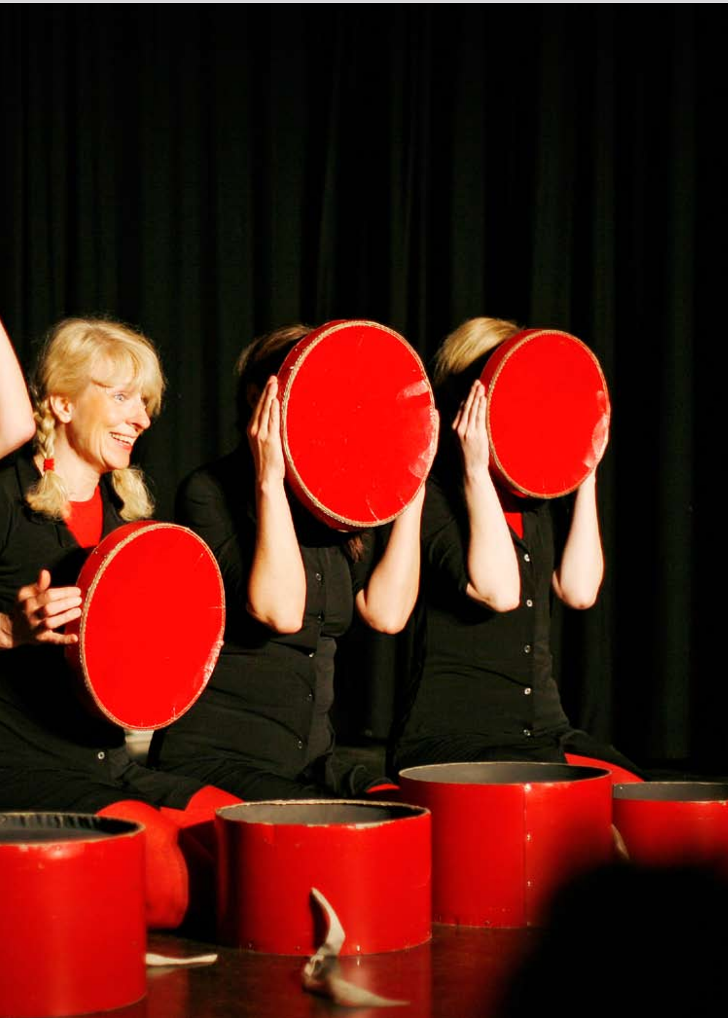
Forestilling på Deichmanske bibliotek, Grünerløkka filial.