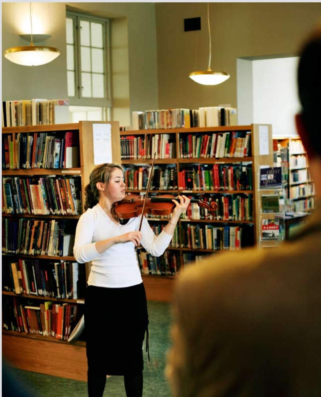
Bergen off. bibliotek.

Operasjonelt mål: Prioriterte områder for bibliotekforskningen skal være et tydelig innslag i programplanen for et nytt kulturforskningsprogram og andre relevante forskningsprogrammer.