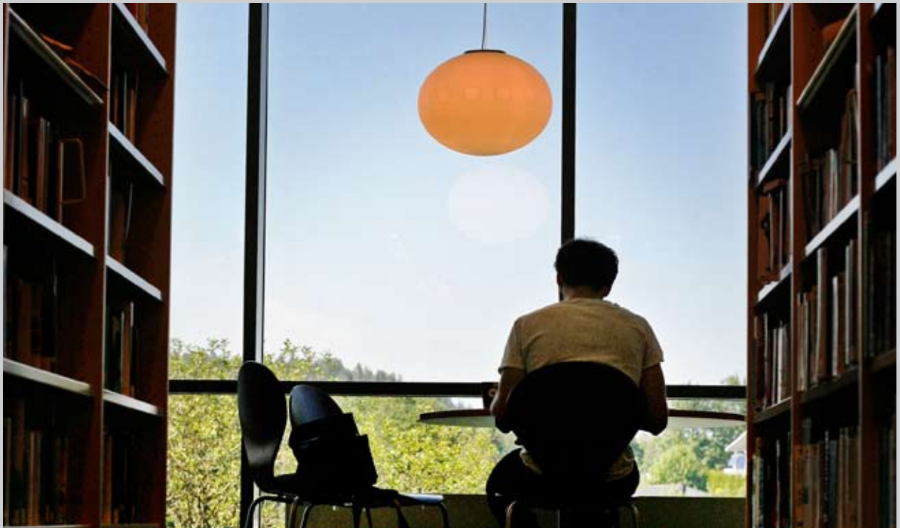
Kolbotn bibliotek.

på dem som skal følge opp gjennomføringen av utredningen og dem som ønsker å få en grunnleggende innføring i sektoren.