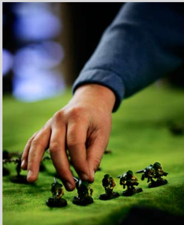
Moss bibliotek.

«Regjeringen vil føre en aktiv politikk for å styrke folkebibliotekene over hele landet. [...] Vi vil investere i mennesker ved å gi dem adgang til utvikling og ny kunnskap i barnehagen og skolen, i høyere utdanning, i etter- og videreutdanning, og gjennom forskning.» (Politisk plattform for en flertallsregjering 2005)