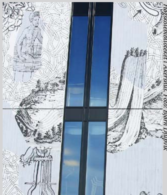
Høgskolebiblioteket i Akershus.

Strukturreformene må følges opp med et program for å videreutvikle det fysiske biblioteket. Her er målet at bibliotekene skal være attraktive møteplasser i lokalsamfunn og utdanningsmiljø.