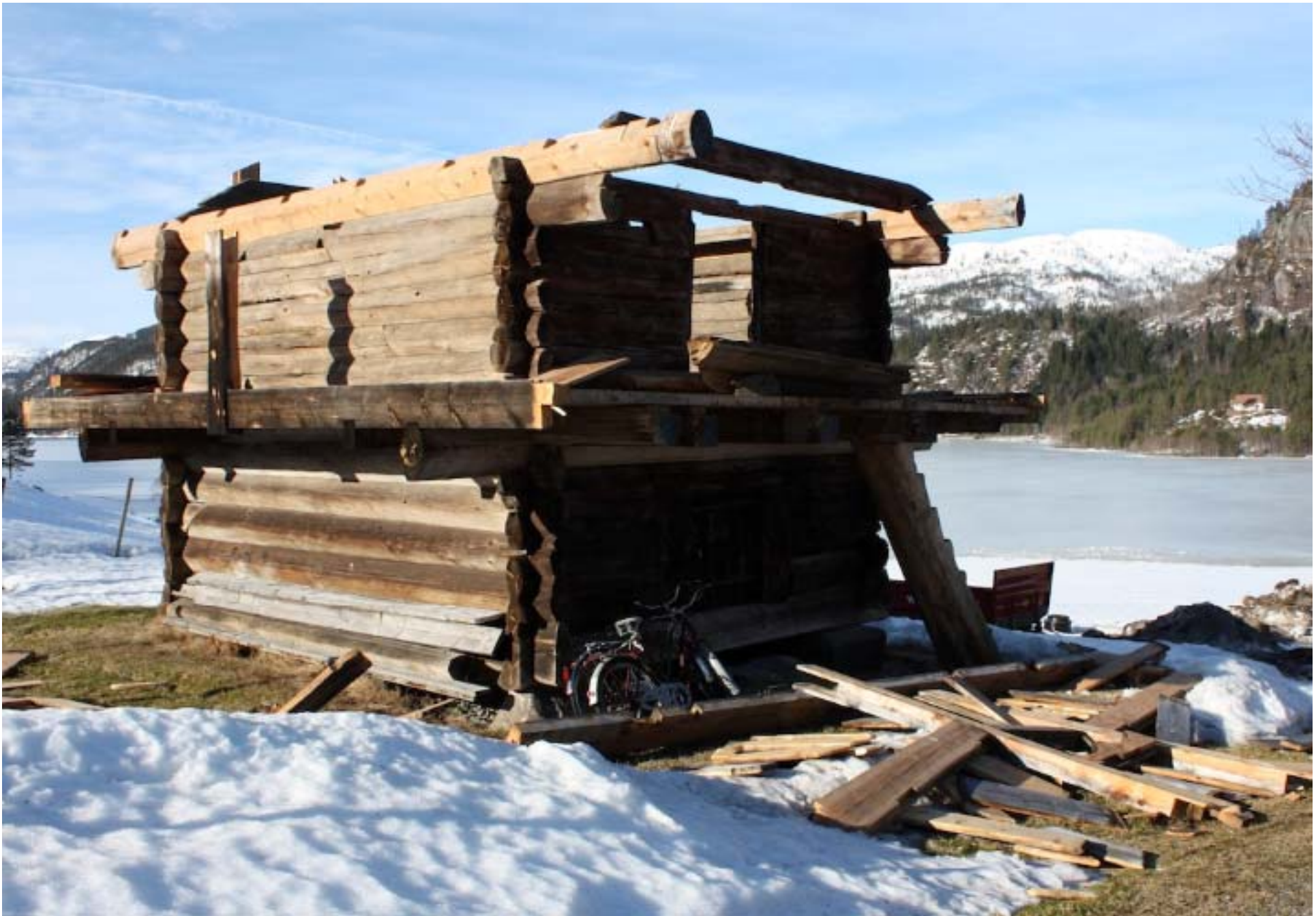
Stabbur tatt av storm i Åseral.