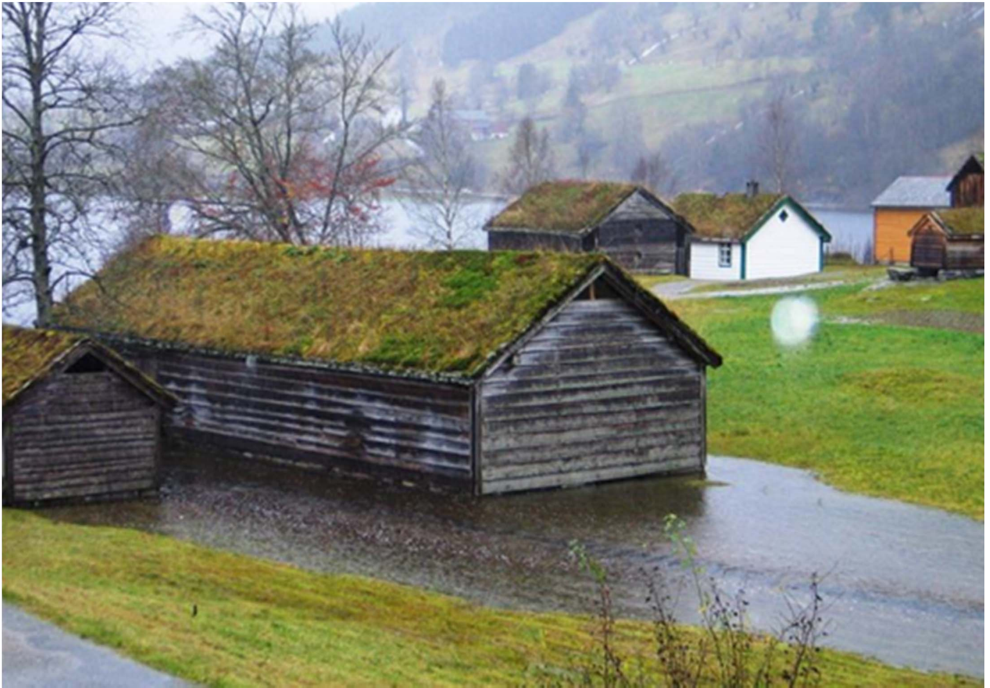
| Sunnfjord Museum, Musea i Sogn og fjordane