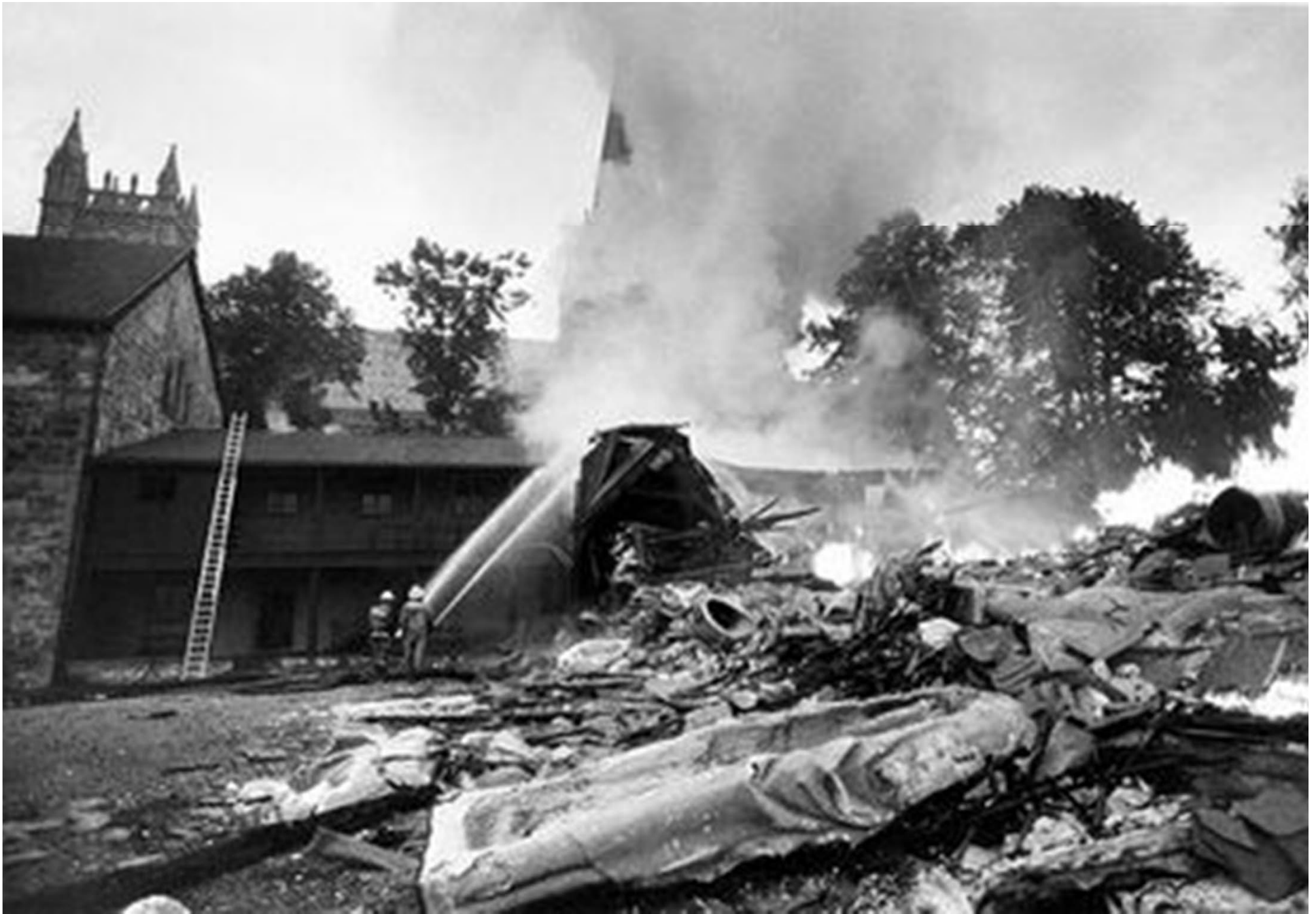
Brannen i Erkebispegården, Trondheim 1983