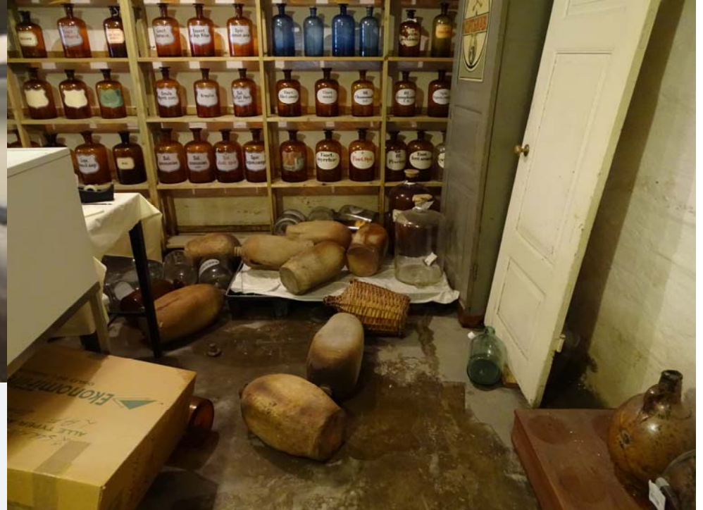
Flere utstillinger ble ødelagt på Folkemuseet i Oslo.