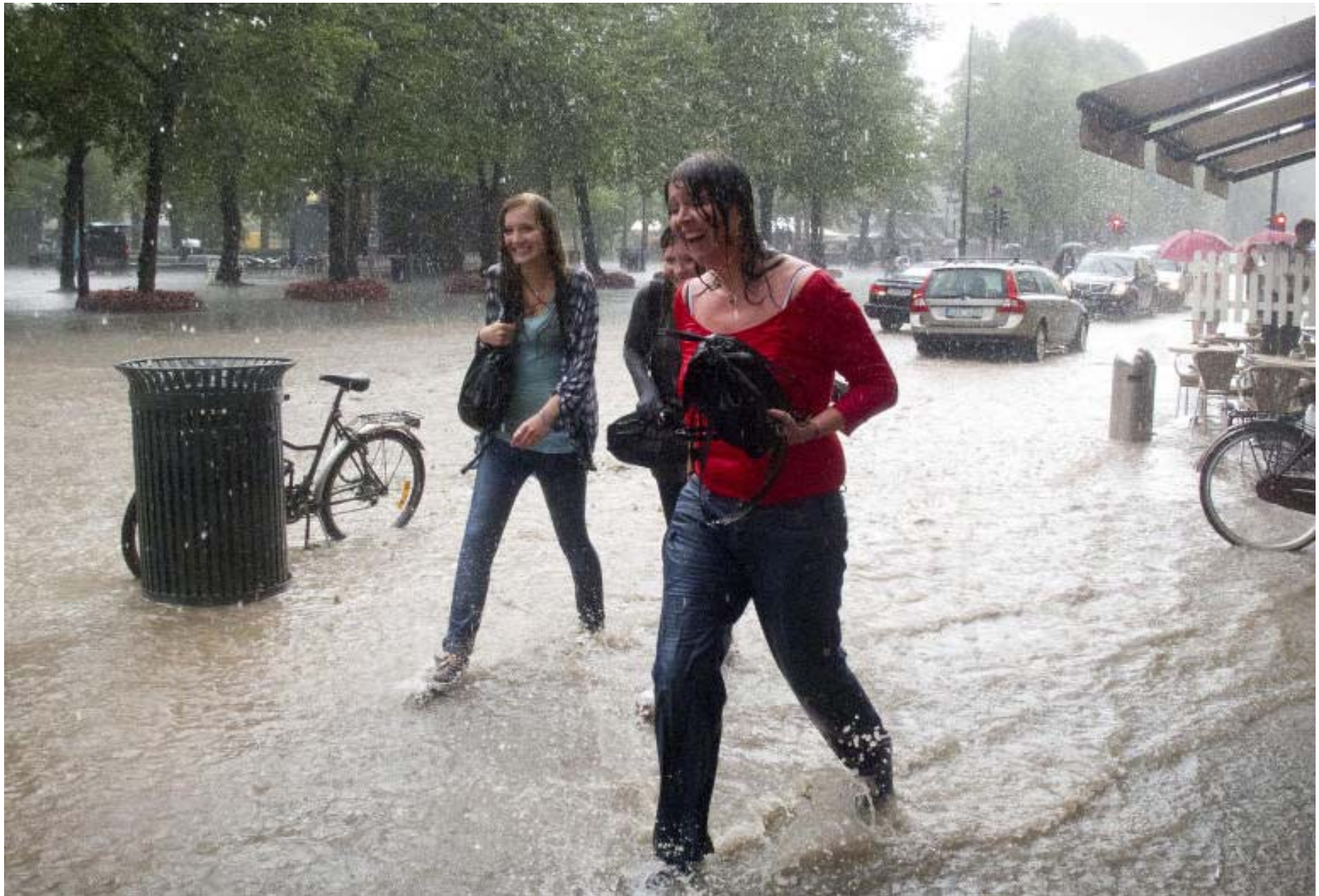
Et voldsomt regnvær overrasket Oslo sentrum. Karl Johan flommet over.