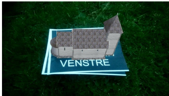
Masterstudentens testing av AR – utvidet virkelighet – ved bruk av den animerte middelalderkirken St. Nikolas

Vi har hatt et veldig godt samarbeid med Høgskolen i Østfold, og både fra museets og skolens side er vi interessert i å fortsette samarbeidet.