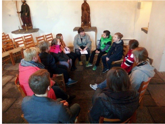
Omvisning om middelalderbyen Borg før dataspilling