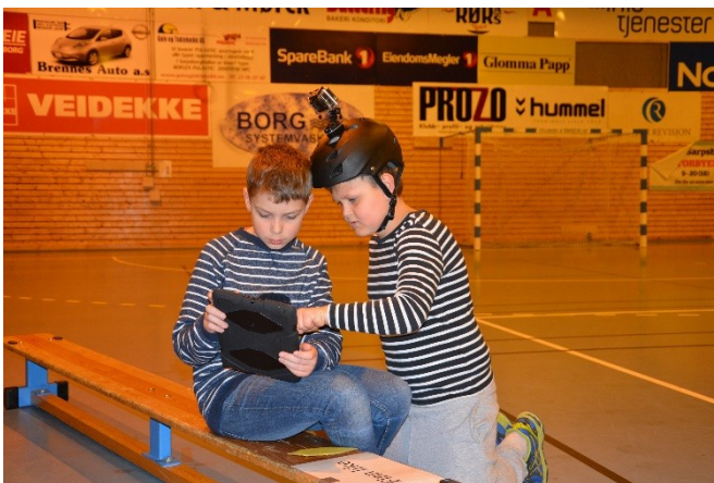
Fra brukertest på Borgapp med Beacons