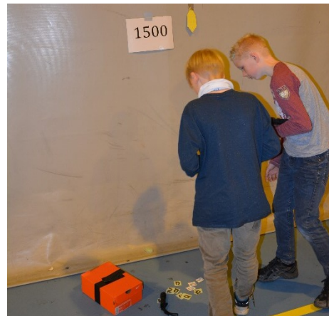
Skoleelver fra 4.trinn tester ut appen

Masterstudenten vi samarbeider med om bruk av utvidet virkelighet (AR) i formidlingen av middelalderhistorie går også sin gang. Studenten har valgt å utsette innleveringen til høsten for å få bedre tid til å utforske de ulike programmene. Utsettelsen vil også gi ham bedre tilgang til det nye formidlingsbygget med tilhørende tårn som også skal åpnes 29. juli. Samarbeidet med studenten vil fortsette frem til hans innleveringsfrist i oktober 2016.