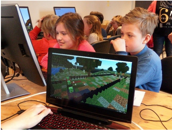
Fra brukertest på Minecraft med skoleelver

Prosjektet har gått etter planen, men har fått noen tillegg. Etter siste innsendte prosjektplan i oktober fikk vi tilslag fra to bachelorgrupper ved Høgskolen i Østfold. Den ene ville være med å utvikle Minecraft-prosjektet og den andre ville være med å utvikle en app som formidlingsverktøy for barn der vi tester ut bruk av beacons i utstillingssammenheng. Begge grupper har nå levert sin bacheloroppgave med glans, og vi jobber i disse dager med å fullføre og tilpasse produktene til utstillingen som skal åpnes på Borgarsyssel museum 29. juli 2016. Minecraft-prosjektet vil utover sommeren og høsten videreutvikles til et undervisningsopplegg for 4.trinn i Sarpsborgskolene.