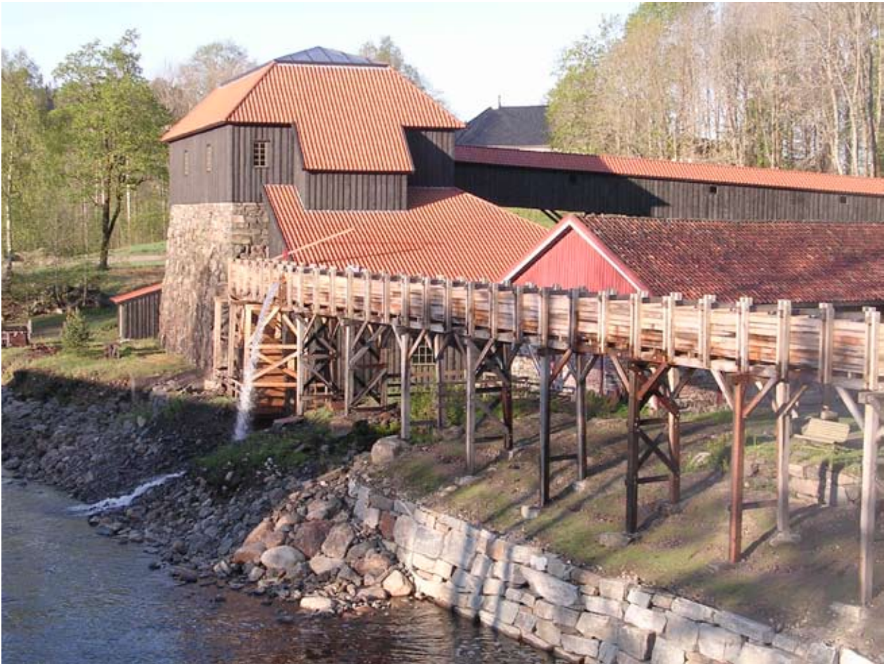
Den gjenoppbygde masovnsbygningen på Næs med vannrenne og vannhjul.

det, men av dem jeg snakket med var det bare én som nevnte nett-informasjon; han fortalte at kona pleide å gå på nett for å sjekke programmet og bestille billetter til kammermusikkfestivalen i Risør.