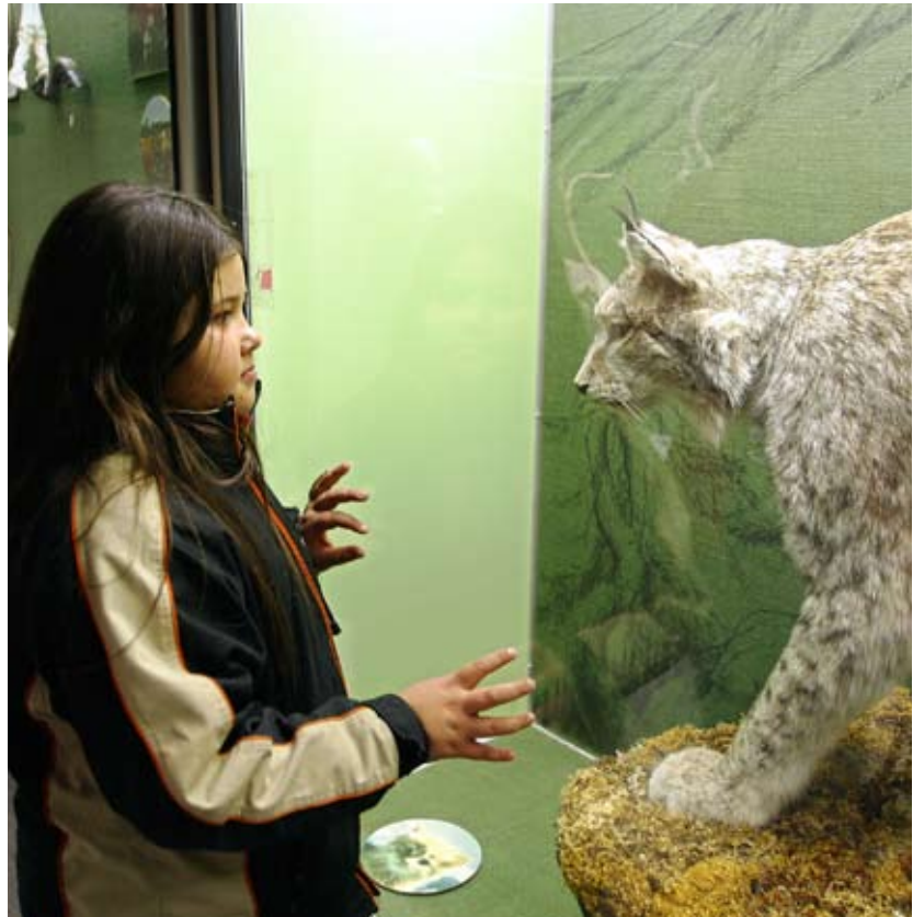
Naturhistorisk museum, Oslo.